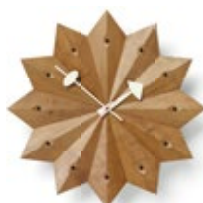
Fan Clock, Kirschbaum (USA), Ø 384