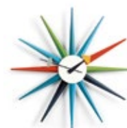
Sunburst Clock, mehrfarbig, Ø 470