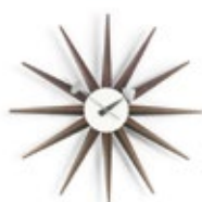
Sunburst Clock, Nussbaum, Ø 470