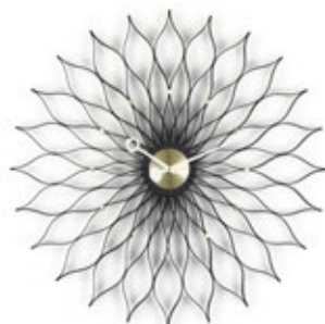
Sunflower Clock, Esche schwarz/Messing, Ø 750