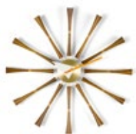
Spindle Clock, Aluminium, Walnuss massiv, Ø 577