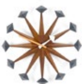
Polygon Clock, Nussbaum, Ø 430