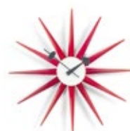
Sunburst Clock, rot, Ø 470