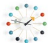
Ball Clock, mehrfarbig, Ø 330