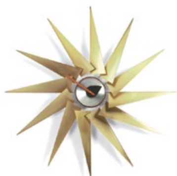
Turbine Clock, Messing/Aluminium, Ø 765