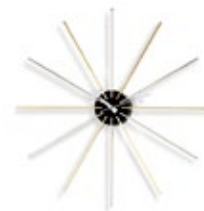
Star Clock, Chrom/Messing, Ø 610