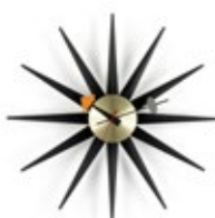
Sunburst Clock, schwarz/Messing, Ø 470