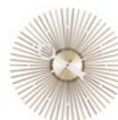
Popsicle Clock, Nussbaum, Ø 350