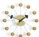
Ball Clock, Kirschbaum, Ø 330