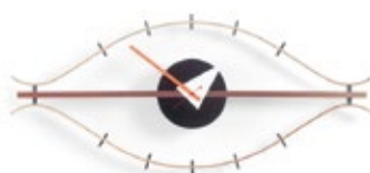
Eye Clock, Messing/Nussbaum, H 340 x B 760