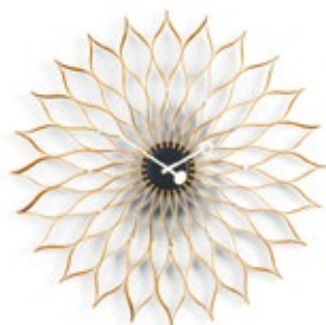
Sunflower Clock, Birke, Ø 750