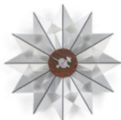
Flock of Butterflies, Aluminium, Ø 610