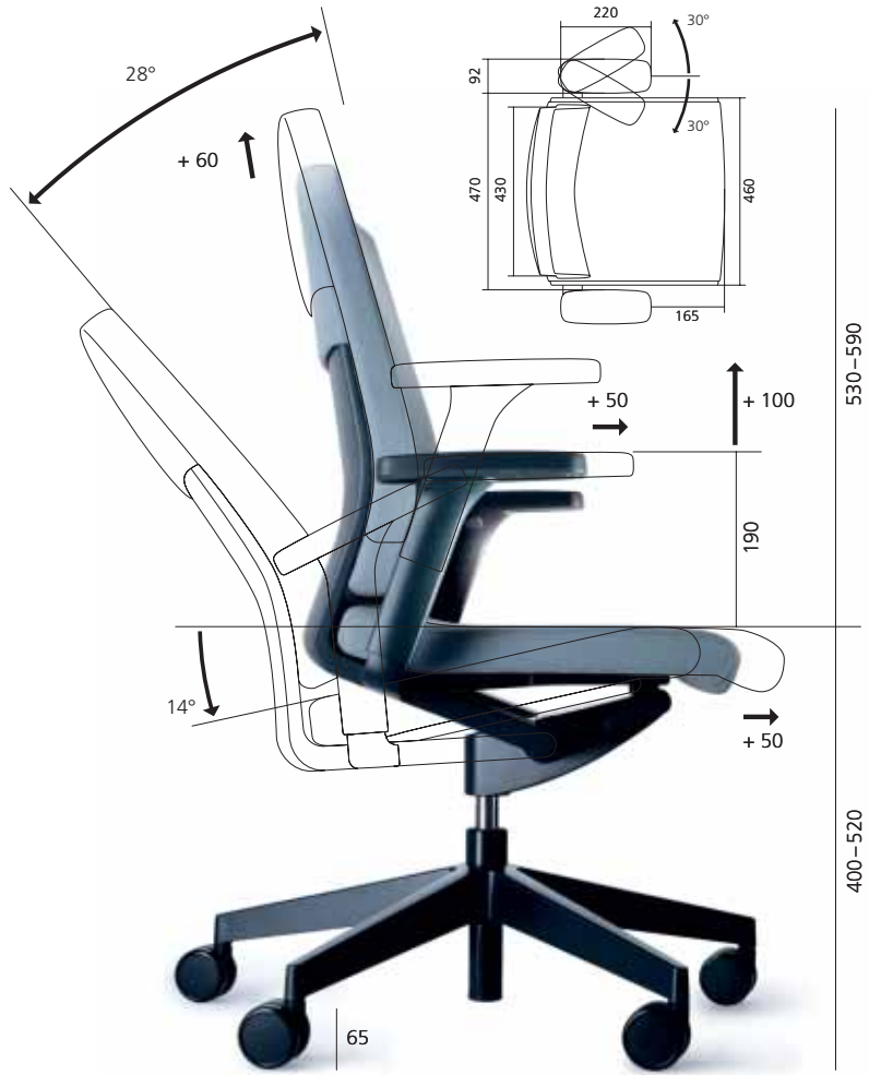
Maßangaben in mm

Aktuelle Umweltinformationen sind auf der Wilkhahn-Internetseite hinterlegt.