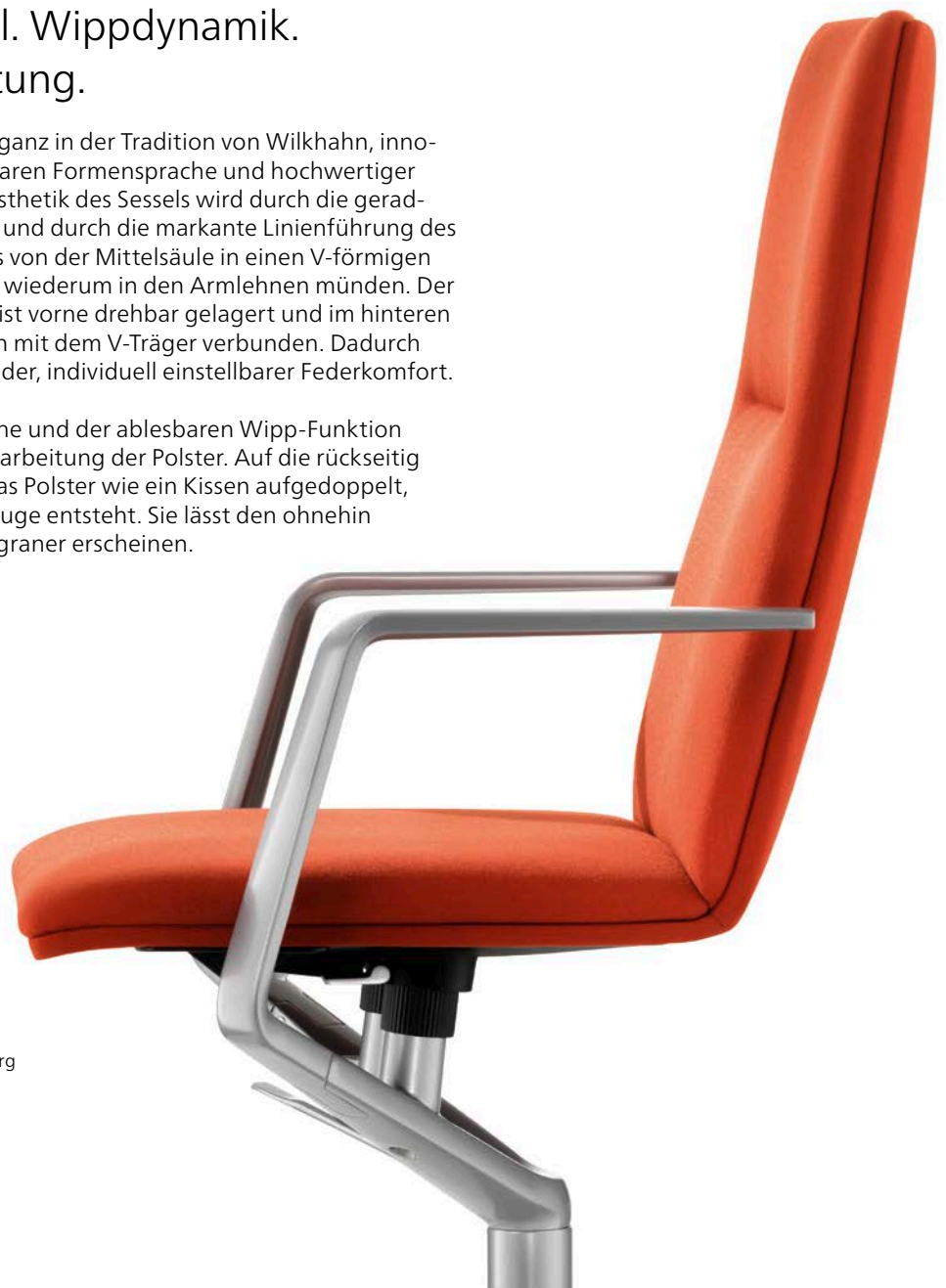
Sola Design: Justus Kolberg

Neben der klaren Formensprache und der ablesbaren Wipp-Funktion überzeugt die hochwertige Verarbeitung der Polster. Auf die rückseitig bezogene Formholzschale ist das Polster wie ein Kissen aufgedoppelt, sodass eine feine umlaufende Fuge entsteht. Sie lässt den ohnehin schlanken Querschnitt noch filigraner erscheinen.